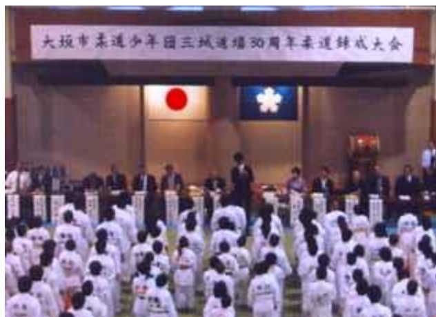
三城柔道少年団 30 周年練成大会