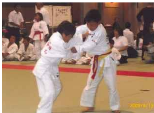
30 周年練成大会の様子