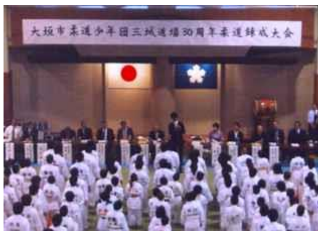
三城柔道少年団 30 周年練成大会