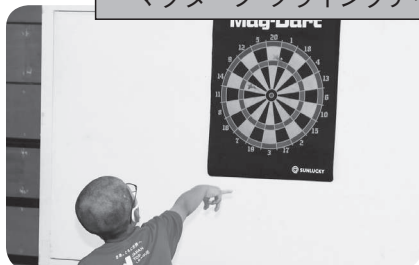
マグダーツ・フライングディスク・ポッチャ体験コーナー